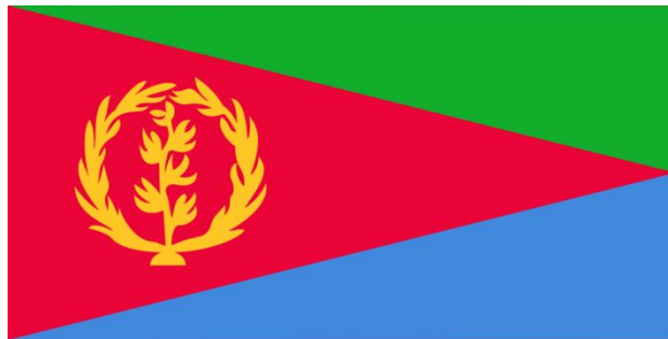
图 2 厄立特里亚国旗

厄立特里亚实行总统内阁制。宪法规定，国民议会是国家最高权力机构和立法机关；实行总统制，总统由国民议会选举产生，任期5年。厄立特里亚法院分乡、县、省、高等法院4级。