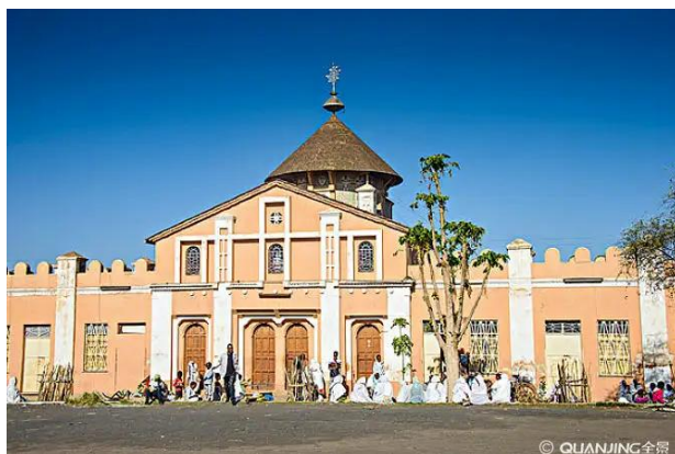
图 3 厄立特里亚风景

截至 2018 年 5 月，厄立特里亚尚未加入世界贸易组织。厄立特里亚是东南非共同市场（COMESA）的签约国。